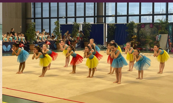
Fêtes - stages